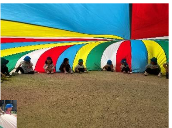
中に入るとカラフルな テントや～と 大盛り上がりでした！

「みぎ、ひだり」と声をそろえこひつじさんこんな風にやっ てた！と言いながら力を合わせて頑張りました！パラバル ーンをひっぱるにも強い力が必要だったりみんなで合わせない と風船やおうちといった技の成功が難しいことなどを知ること ができました！来年こひつじさんではパラバルーンとリ レーですね！今から楽しみです♡