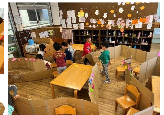
金色と青色の星のトンネル☆ ゴールには〇×クイズもあります！